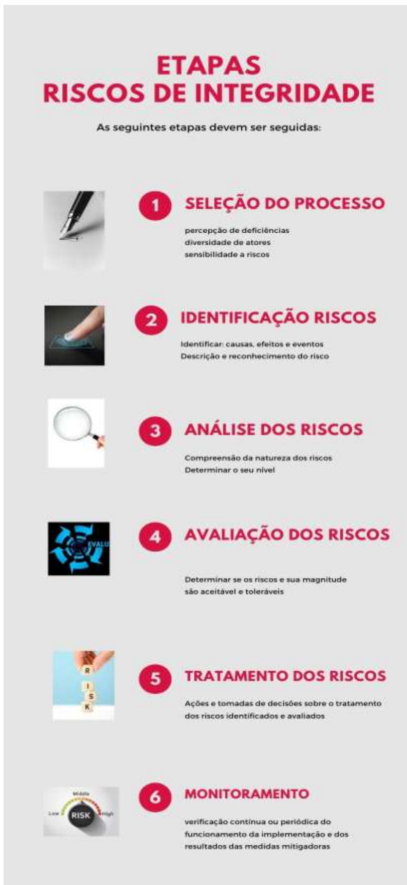
Figura 2 – Etapas para identificação, avaliação e tratamento dos riscos para a integridade