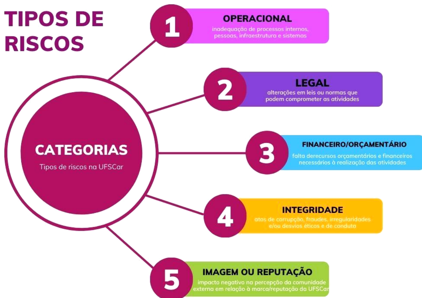
Figura 1 - Categorias ou tipos de riscos existentes na UFSCar